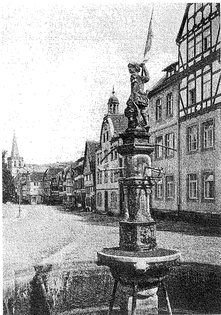
Stadtbrunnen in Vacha Errichtet 1613.