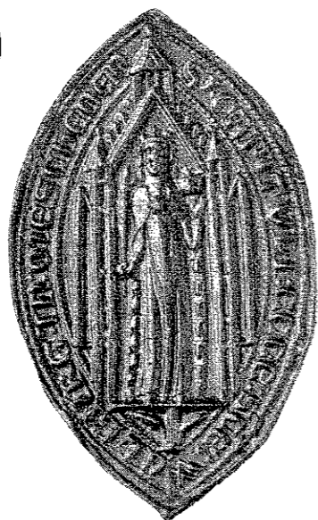
Siegel des Stifts Meschede nach dem Stempel im Staatsarchiv zu Münster, von 1323. Umschrift: s. capituli ecce sce walburg in mescheden. (Vergleiche: Westfälische Siegel, Heft III, Tafel 111, Nummer 6.)