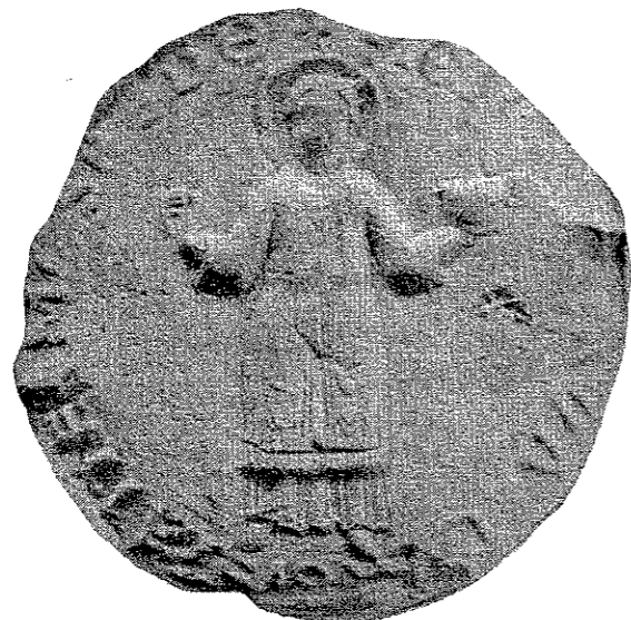
Siegel des Stifts Meschede, von 1177, im Staatsarchiv zu Münster, Oedinghausen U, 5. Umschrift: signu sce walburgis patne i meschede. (Vergleiche: Westfälische Siegel, Heft I, Abtheilung 1, Tafel 9, Nummer 2.)