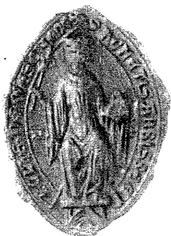
Siegel der Abtissin Agnes von Meschede, von 1258, im Staatsarchiv zu Münster, Soest, Paradies 11. Umschrift: s. agnetis abbisse ecclie de meschede. (Vergleiche: Westfälische Siegel, Heft III, Tafel 128, Nummer 2.)