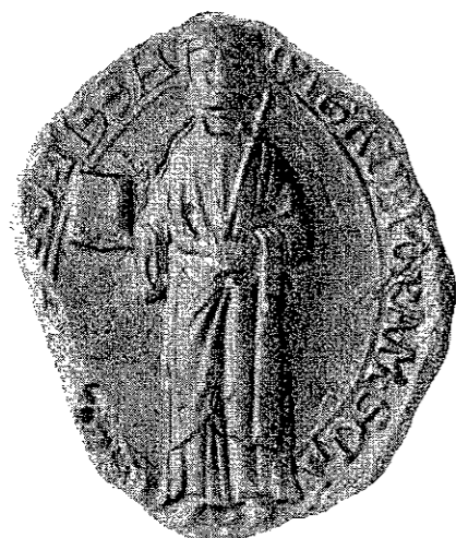
Siegel der Abtissin Jutta von Meschede, von 1207, im Staatsarchiv zu Münster, Wedinghausen 16. Umschrift: jutta dei gra mesche . . . abatissa. (Vergleiche: Westfälische Siegel, Heft III, Tafel 128, Nummer 1.)